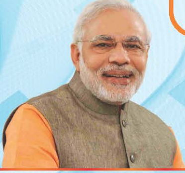
શ્રી નરેન્દ્રભાઈ મોદી