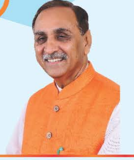
શ્રી વિજયભાઈ રૂપાણી